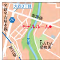
国愛知東岡崎市大平町石竜 93-1 わんわん動物園内