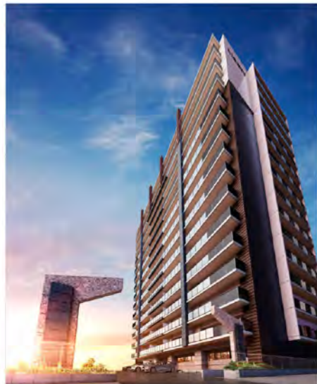
※掲載の完成予想CGは、計画段階のもののため、変更になる場合があります