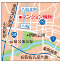
国愛知東岡崎市八帖北町 3-19ほか